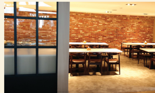
학생회관 부를샘(PDR Room) 48석 학생회관 고를샘(PDR Room) 28석 교내 각종 조찬 행사 출장 뷔페 가능