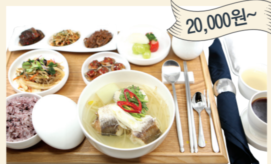
구성메뉴 한식 / 양식