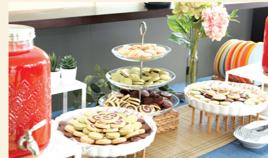
구성메뉴 5,000원 음료 외 1종 / 7,000원 음료 외 2종 10,000원 음료 외 5종 / 12,000원 음료 외 8종