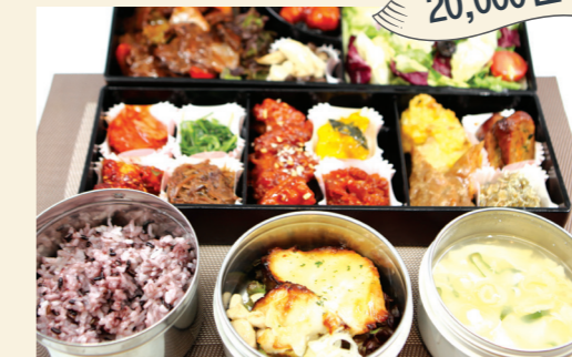
구성메뉴 프리미엄 소불고기 & 장어 프리미엄 소불고기 & 메로 프리미엄 소불고기 & 전복 프리미엄 소불고기 & 폭찹