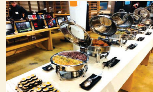
20,000원 소불고기 외 20종 30,000원 소갈비찜 외 30종