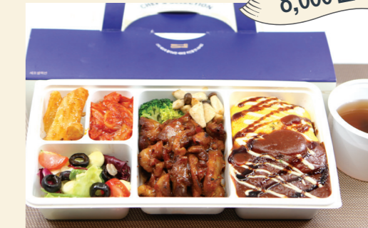
구성메뉴 몽골리안치킨덮밥/중화잡탕밥/차슈벤토/ 토리벤토/불고기벤토/삼겹살덮밥/ 불닭오므라이스/소시지오므라이스/ 함박스테이크