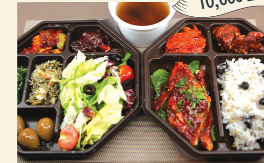
구성메뉴 9첩소불고기/9첩황태구이/ 9첩쭈꾸미/9첩삼치구이