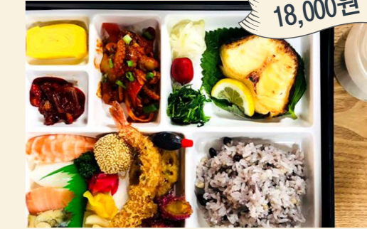
구성메뉴 일식도시락 (메로구이/쭈꾸미 볶음/초밥 4종/튀김 3종/ 젓갈류/일식계란/나물류/잡곡밥/미소장국)