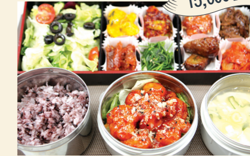
구성메뉴 찬함소불고기/찬함황태구이/찬함연어구이/ 찬함칠리새우/찬함쭈꾸미